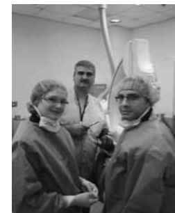
Im Herzkatheterlabor standen einem die Ärzte mit Rat und Tat zur Seite

Die Tage begannen mit der Morgenvisite mit darauffolgender Besprechung der einzelnen Patienten samt Krankheiten, deren Ätiologie, Folgen und Therapie im Seminarraum. Eine weitere Schulung fand täglich am Nachmittag statt. Zusätzlich gab es noch Seminare und POL-Sessions