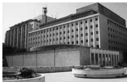
Das Medical Center der Amerikanischen Universität samt Bibliothek

In der folgenden Woche fand sich dann doch noch ein Famulaturplatz für mich: Kardiologie. Am ersten Tag durfte ich einer Assistenzärztin folgen, die an diesem Tag für Konsultationen verantwortlich war. Nachdem es dann später etwas ruhiger wurde, schrieb sie mir eine SMS, sobald wir wieder einen Patienten hatten. So konnte ich in der Zwischenzeit bei Herzechos zusehen und die anderen Ärzte kennen lernen. Schon beim ersten Echo wurde alles ganz genau erklärt. Bei den nächsten Echos wurde ich dann immer