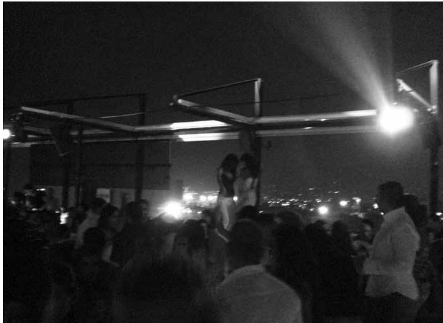
Eine von mehreren Freiluftdiscos, die meist mehr als gut besucht waren.

tritt immer noch die Traumatisierung und gegenseitige Skepsis durch den langjährigen Bürgerkrieg, der im wesentlichen (und soweit ich das bisher beurteilen kann) durch die demografische Entwicklung (Mehrheitsverhältnisse haben sich langsam zugunsten der Muslime verändert, zusätzlich Zuwanderung palästinensischer Flüchtlinge) im Libanon und die Aufrüstung einzelner libanesischer Organisationen durch das Ausland zustande kam, zutage. Erzählungen lassen die Grausamkeiten und Entbehrungen dieser vielen Jahre nur erahnen. Vor dem Bürgerkrieg wurde der Libanon immer als Paris des Nahen Ostens bezeichnet, in welchem sich die High Society regelmäßig getroffen und in dem jedes namhafte Modelabel seine Kleider angeboten hat. Doch mittlerweile ist die Schönheit des Landes, aber auch der Leute, wieder zurück gekehrt.