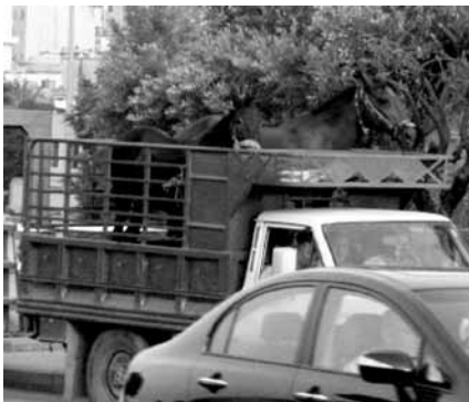
Der Pferdetransport funktioniert im Libanon doch etwas anders.

Ob dieses Wort dort schon jemand einmal gehört hat? Straßenmarkierungen gibt es dort zur Zierde, überholt wird wo Platz ist - zwischen zwei