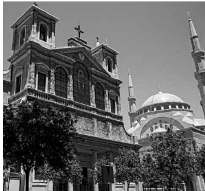
Ein Zeichen für die Vielfältigkeit der Glaubensgemeinschaften.

Landschaftlich ist der Libanon sehr vielfältig. So kann man innerhalb von 15 Minuten von den Skigebieten aus