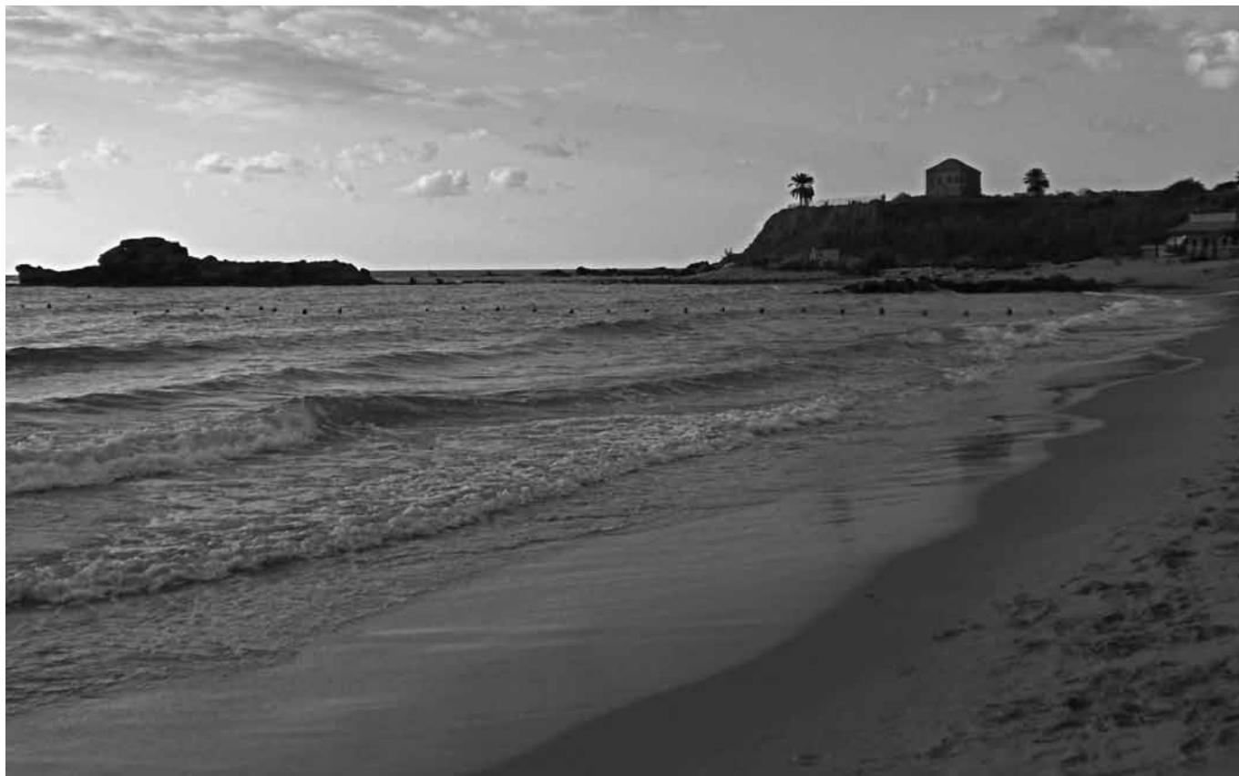
Von den Skigebieten in den Bergen kommt man in 15 Minuten an den Strand

Das Zusammenleben der 18 im Libanon anerkannten Religionsgemeinschaften